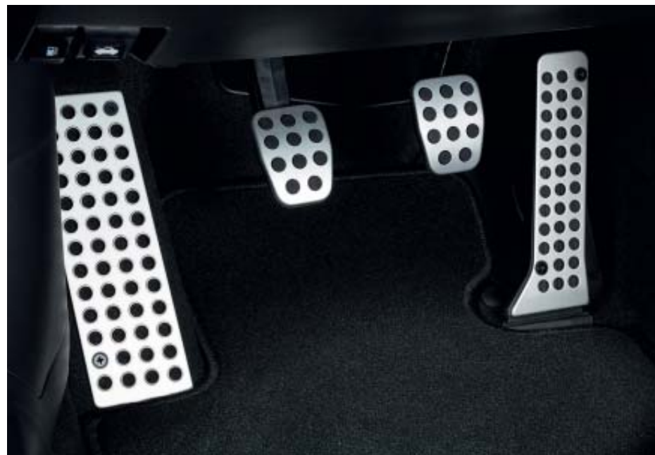
Sada hliníkových pedálů