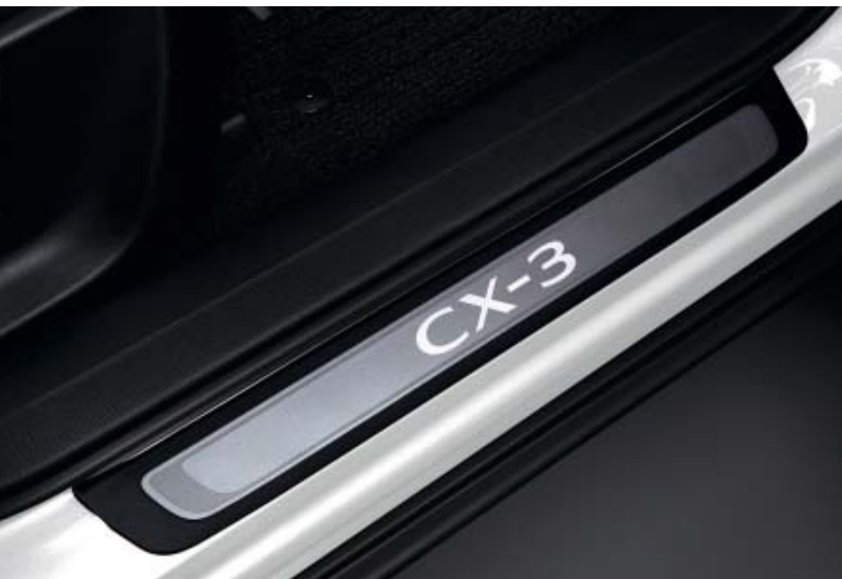
Osvětlené lišty prahů

Pozorně jsme navrhli příslušenství, které krásně doplňuje vaši Mazdu CX-3 pro rok 2021. Máte-li zájem o kompletní seznam originálního příslušenství Mazda pro vaši Mazdu CX-3 pro rok 2021, navštivte naše webové stránky.