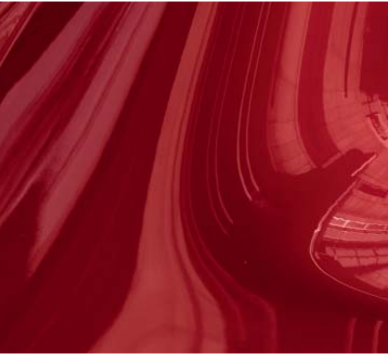
Soul Red Crystal