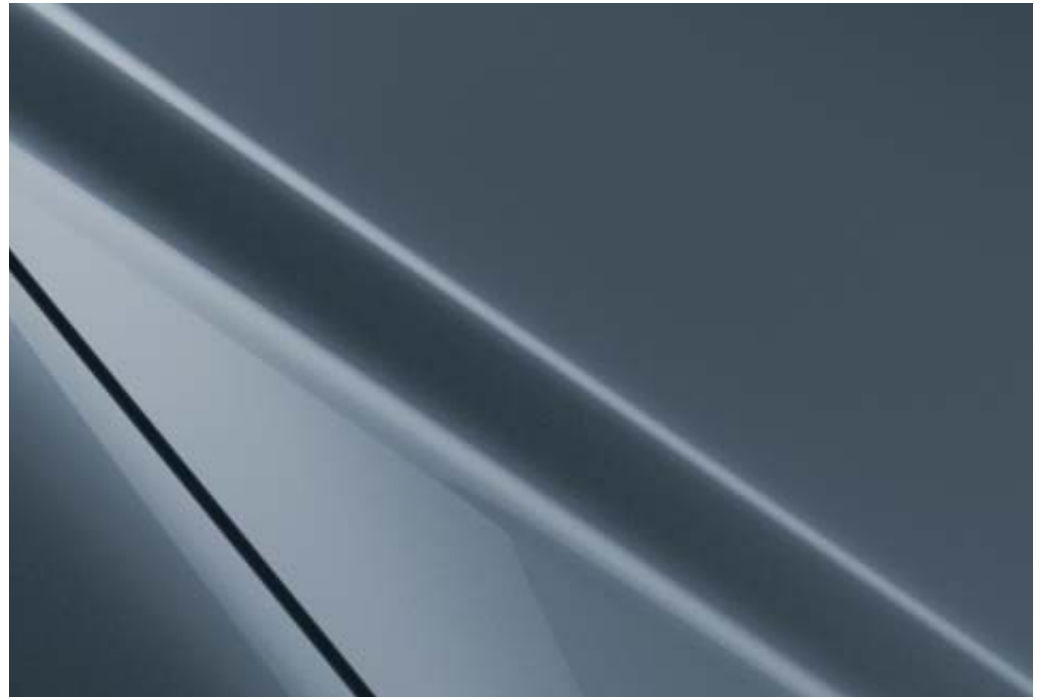
Polymetal Gray Metallic